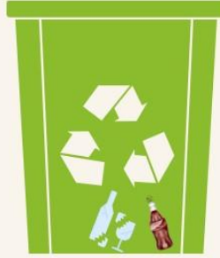
CAM/ŞİŞE GERİ DÖNÜŞÜM KUTUSU

Üzerinde kağıt, defter, kitap resmi yer alır! Buraya sadece kağıt ile ilgili atıklarınızı atmalısınız!