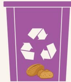
EKMEK GERİ DÖNÜŞÜM KUTUSU

Üzerinde metal, demir resmi yer alır! Buraya sadece metal, demir vb. ile ilgili atıklarınızı atmalısınız!