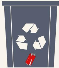
METAL GERİ DÖNÜŞÜM KUTUSU

Üzerinde plastik vb. atık resmi yer alır! Buraya sadece plastik ile ilgili atıklarınızı atmalısınız!