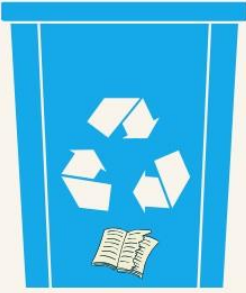
KAĞIT GERİ DÖNÜŞÜM KUTUSU