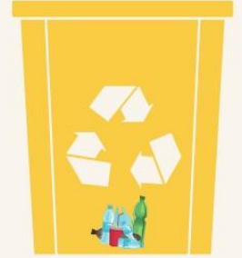
PLASTİK GERİ DÖNÜŞÜM KUTUSU

Üzerinde cam, şişe resmi yer alır! Buraya sadece cam, şişe vb. ile ilgili atıklarınızı atmalısınız!